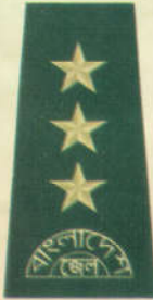
ডেপুটি জেল সুপার