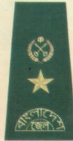
সিনিয়র জেল সুপার