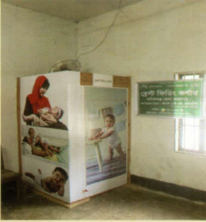
কারাগারগুলোতে আটক সাক্ষাৎপ্রার্থীদের একটি বড় অংশ মহিলা এবং মায়ের সাথে শিশু। সাক্ষাৎপ্রার্থী মায়ের সাথে শিশুদেরকে ব্রেস্ট ফিডিং এর কোন ব্যবস্থা পূর্বে না থাকায় প্রথম বারের মতো ২৮ এপ্রিল ২০১৯ তারিখে মানিকগঞ্জ জেলা কারাগারে সাক্ষাৎকক্ষের পাশে দর্শনাধী মায়াদের সুবিধার্থে ব্রেস্ট ফিডিং সেন্টার চালু করা হয়।