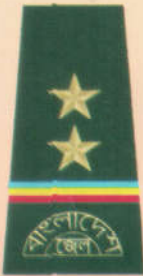
সর্ব প্রধান কারারক্ষি