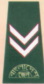
সহকারী প্রধান কারারক্ষি