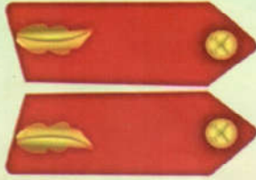
কারা উপ মহা পরিদর্শক কলার জর্জেট