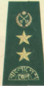
কারা উপ মহাপরিদর্শক