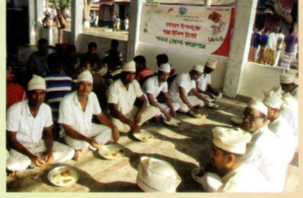
পহেলা বৈশাখে বাংলা নববর্ষ উপলক্ষে পূর্বে কারাগারগুলোতে পাশা, ইলিশ পরিবেশন করা হলেও এর জন্য কোন আলাদা বরাদ্দ ছিলনা। এবারই প্রথম বাংলা নববর্ষ উপলক্ষে বন্দিপ্রতি ৩০(ত্রিশ) টাকা বরাদ্দ দেয়া হয় এবং কারা বন্দিদের মাঝে উন্নতমানের খাবার পরিবেশন করা হয়।