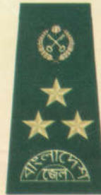
অতিরিক্ত কারা মহাপরিদর্শক